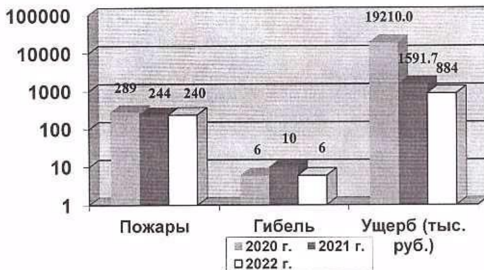
Количество пожаров и их последствия

Обстановка с пожарами на территории муниципального образования «Мирнинский район» Республики Саха (Якутия) по сравнению с аналогичными периодами прошлых лет характеризуется следующими показателями: